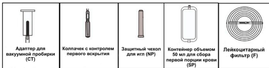
Рис. 1 КОМПОНЕНТЫ СИСТЕМЫ